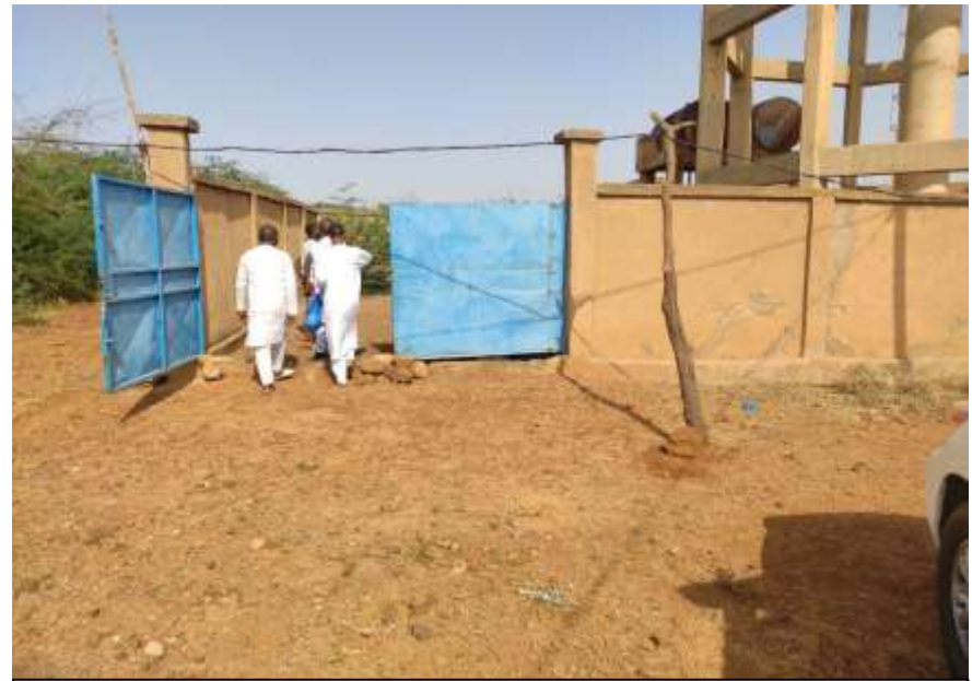
Mission de Contrôle des délégataires sur le site de l'Opérateur de Galmi