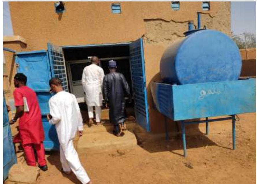
Mission de Contrôle des délégataires sur le site de l'Opérateur de Galmi

QUELQUES PHOTOS DES ACTIVITÉS DE REGULATION