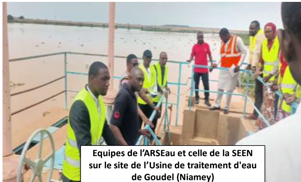
Equipes de l'ARSEau et celle de la SEEN sur le site de l'Usine de traitement d'eau de Goudel (Niamey)