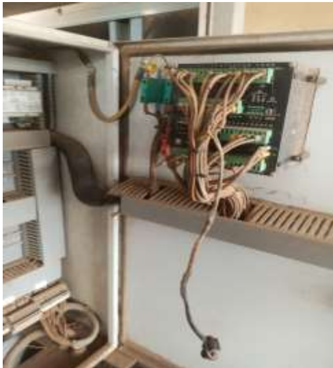
Installations de Galmi visitées