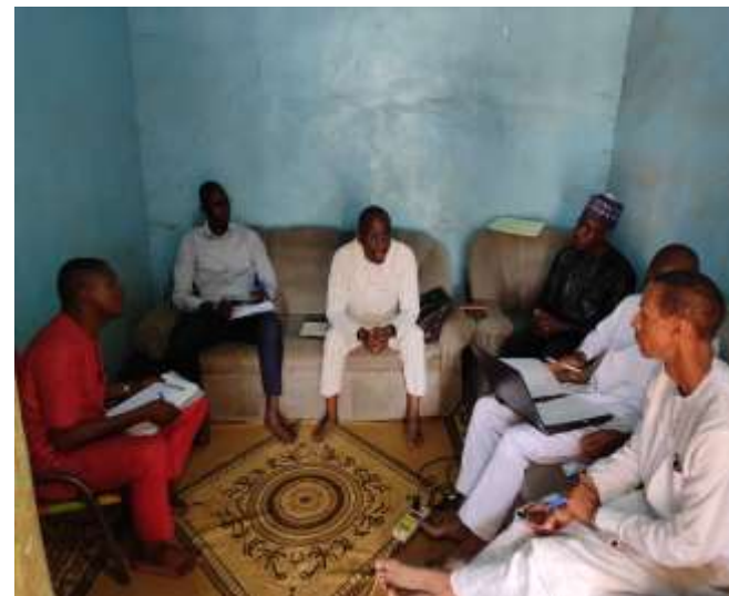
Entretien Equipe de l'ARSEau et le Délégué de Galmi