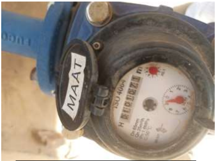
Installations de Galmi visitées