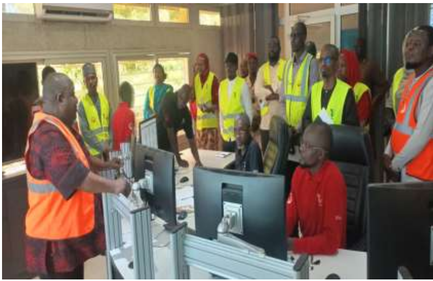
Mission de Contrôle à l'Usine de Goudel