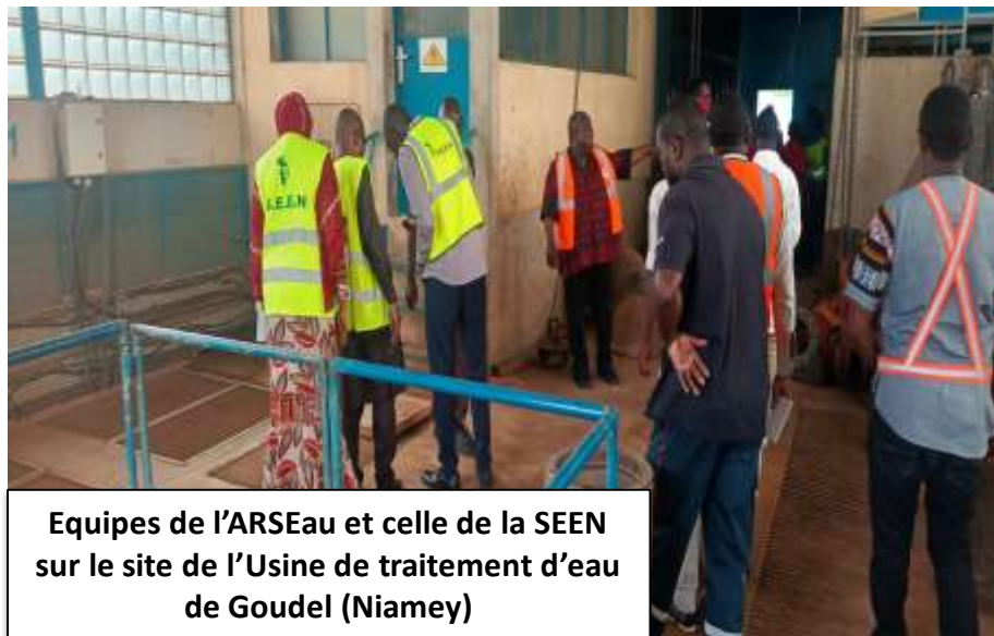
Equipes de l'ARSEau et celle de la SEEN sur le site de l'Usine de traitement d'eau de Goudel (Niamey)