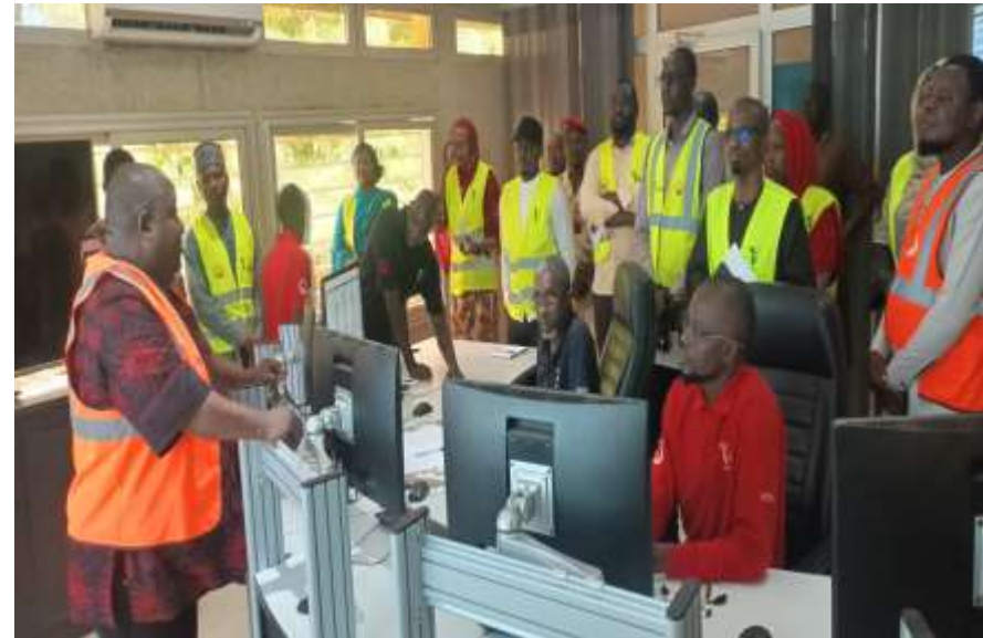
Mission de Contrôle à l'Usine de traitement d'eau de Goudel