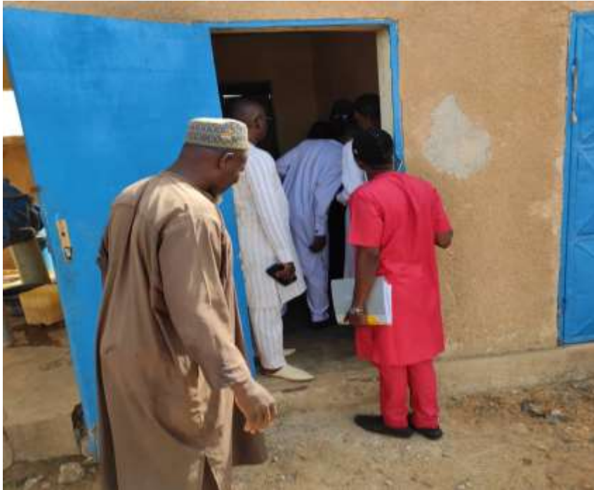
Mission de Contrôle des délégataires sur le site de l'opérateur de Galmi